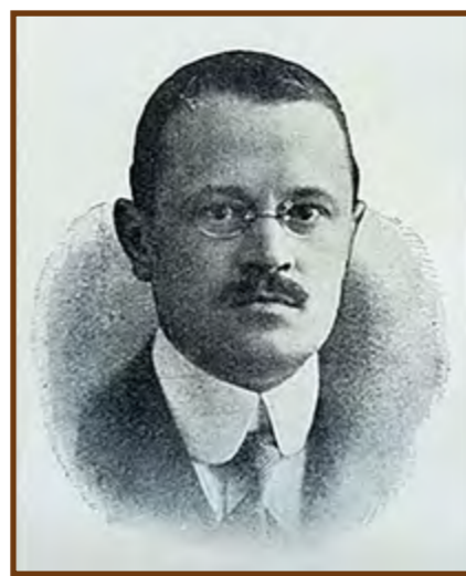
Pintér Jenő 1913-ban

Az év végi nagyon részletes beszámolójában olvasható: „ Általában: életrevaló, hasznos intézménnyé iparkodtunk tenni körünket. Ezért ismertettük például tizen-tesen a matematikai és a philológiai ifjúsági versenyek intézményét és eredményeit; ezért készítettük el beható megvitatás után új alapszabályainkat; ezért ismertettük részletesen a tizenkilencedik század francia líráját; ezért foglalkoztunk hosszasan a szavalás elméletével s a művészeti kritika alapelveivel. ”