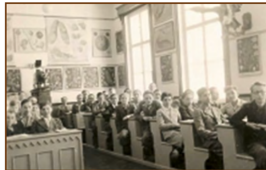
1920-as évekből egy osztálykép a pécsi jezsuita gimnáziumból