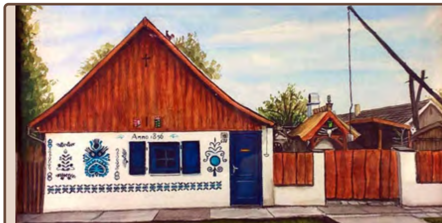
A Mócsi-féle néprajzi ház