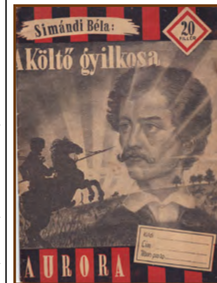
Simándi Béla könyvének címlapja

Egy emlékező szerint, Fülöpszálláson a Morgó vendégházában is született Petőfi Sándor, mégpedig karácsonykor. A fogadó fölött akkor egy „nagy vörös üstökű csillagot” láttak. A csecsemő foggal született, mint a táltosok. Fülöpszálláson azt is megtudta a riporter, hogy Petőfi nem halt meg a segesvári csatában, Törökországba bujdosott. Aztán visszatért Fülöpszállásra – szülőhelyére! „Hol temették el – nem tudom. Talán meg sem hal az ilyen ember” – így nyilatkozott az emlékező a Morgó csárdában. Ezen szavakkal zárult a riportsorozat Fülöpszálláson. Az emlékező ezen utolsó mondata bizony igaz. „Akinek ilyen sok szülőhelye legyen, nem ütheti annak emlékét az idő agyon.” (SZ. G. A.: „Búcsúzó a Morgó vendégházához”).