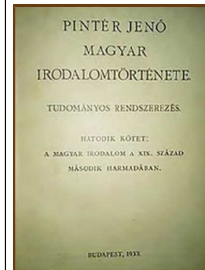
Pintér Jenő: A magyar irodalom története, hatodik kötet

Írói munkássága nagyon gazdag eredményű. A főgimnáziumban eltöltött öt év öt értekezése csak porszem az életművében. A jászberényi tanársága alatt számos ismeretterjesztő írása, közművelődést előmozdító cikke jelent meg a Jászberény, a Jász Kürt című lapokban és számtalan az országos lapban, folyóiratban. Nagy terjedelmű munkái közül a mai napig használható nyolckötetes műve, A magyar irodalom történet tudományos rendszerezés (Budapest 1930–1941), melyet itt is meg kell említeni.