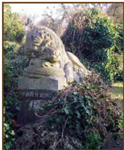
Pintér Jenő síremléke a Fiumei Úti Sírkertben - Bory Jenő alkotása

1940. november 7-én elhunyt, sírja a Fiumei Úti Sírkertben található. Az özvegye (Battlay Borbála a második felesége volt, az elsőől, Reiner Vil máttól elvált) kérésére egy ledőfött oroszlán a síremléke, Bory Jenő alkotása. Úgy gondolta az özvegy, hogy a meg nem értettség okozta a halálát 59 évesen.