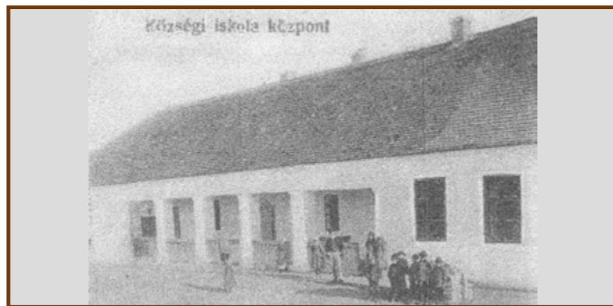
Az orgoványi csárda, Petőfi legendabeli szülőhelye

Vasberényi Géza az 1970-es években büszkén mutatta nekem Petőfi összes költeményeinek 1849-es Kertbeni Károly fordításában megjelent német kötetében található állítását, miszerint Petőfi Dunavecsén született. Persze ezen még Vasberényi Géza is mosolygott. Mint említette, ezt a kötetet még Petőfi is kezében foghatta, de nem tudunk arról, hogy tiltakozott volna dunavecsei szülőhelyét illetően.