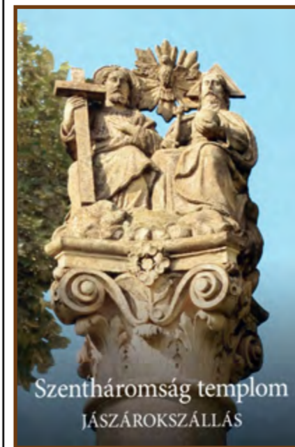
A könyv címlapja

hogy betérjen a település immár megújult ékességébe. A 660 négyzetméteres, 44,4 méter hosszú, 15 méter széles és 47,2 méter magas templom a természetével is felhívja magára a figyelmet. Tornyában négy harang található, a legnagyobb, 16 mázsást 1799-ben öntötték Pesten, Kohl János harangöntő műhelyében. A szerzők: „Szülőhelyünk vonatkozásában egészen a XVII. századig kell előrelapoznunk a krónikában, hogy eljussunk legrégebb megőrződött épített örökségünkhöz, az imponáns barokk Szentháromság Római Katolikus templomunkhoz. Ezt az elődeink hitéből, pénzből és munkájából