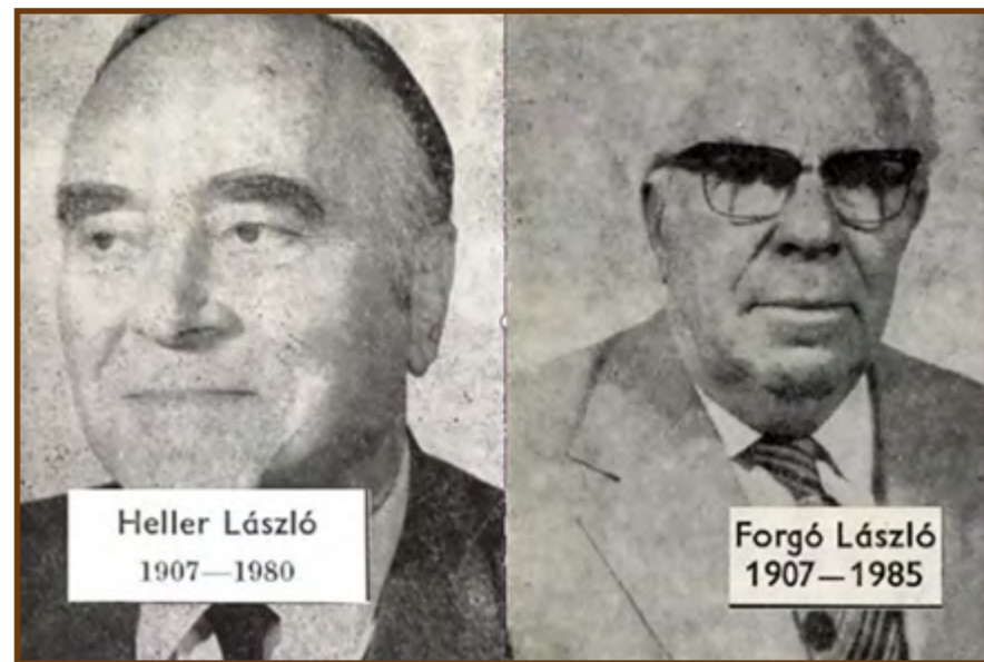
A magyar világszabadalom feltalálójának a fényképe

Tudományos Akadémia rendes tagja, a Budapesti Műszaki Egyetem volt tanszékvezető tanára, az Energiagazdálkodási Intézet műszaki igazgatóhelyettese volt. Az Ajkai Hőerőmű tervezése során dolgozta ki azt a teljesen újszerű eljárást, amely szerint vízszegény helyeken az erőművek hűtése víz helyett levegővel is megoldható, és amely azóta „Heller System” néven világszerte ismertté vált. Forgó László, a Hőtechnikai Kutató Intézet igazgatóhelyettese, az általa feltalált Forgó-féle apróbordás hőcserélők képezik a Heller-rendszerű léghőközpontú berendezés gazdaságosság szempontjából legjelentősebb részét. Forgó László találmányának lényege, hogy az hőcserélő réz helyett alumíniumból készíthető, ami a követelményeknek sokkal jobban megfelel, és jóval olcsóbb. 1956 elején hívták fel László Károly figyelmét, hogy egy prototípus vagy mintadarab legyártására gyártóüzemet keresnek. A jászberényi gyár vezetése felismerte a jövőbeni üzleti lehetőséget, és vállalkozott a feladatra. Az 1957-es budapesti BNV-n már be is mutatták a Fémnyomó által gyártott prototípust. A Heller-Forgó féle világszabadalom az 1958-as brüsszeli világi kiállításon nagydíjat kapott. A világsiker után a legnagyobb angol állami