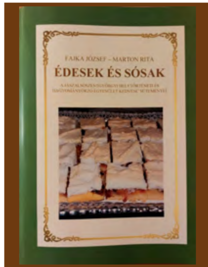
A könyv címlapja