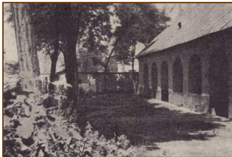
A fülöpszállási Morgó vendégfogadó. Petőfi legendai szülőhelye, 1960

Korán terjedelmes szakirodalmi könyvtárat és Petőfi kultuszgyűjteményt sikerült létrehoznom, ezért a költővel foglalkozó kutatók látogatásai során közvetlen közletről figyelhettem eredményeiket, bírhattam barátságait.