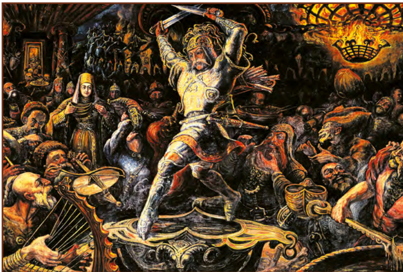
A nartok lakomája (részlet) Vlagyikavkáz, Tuganov képtár

REDEMPTIO (latin szó, ejtsd: redempció) – visszavásárlás, megváltás, önmegváltás. A szó az 1745-ös Jászkun Redemptiora utal, amikor a jászok és a kunok példás összefogással, saját erejükből visszavásárolták kiváltságaikat. Mária Terézia magyar királynő 1745. május 6-án írta alá a jászok és a kunok redempcionális diplomáját.