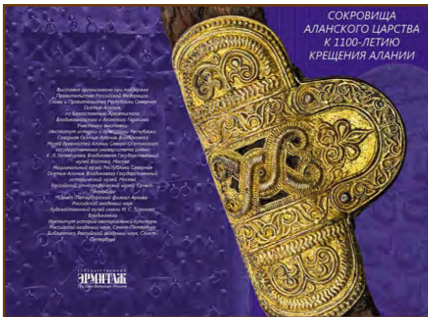
A kiállítás prospektusa

a világ minden tájáról – nagy megtiszteltetés itt kiállítani, és nagy lehetőség a bemutatkozásra. 2022-ben ünnepelték a Kaukázusban, Oszétia-Alániában a kereszténység felvételének 1100. évfordulóját. Ennek a rendezvénysorozatnak egyik állomása az Alánia ókori és középkori történelmét bemutató tárlat.