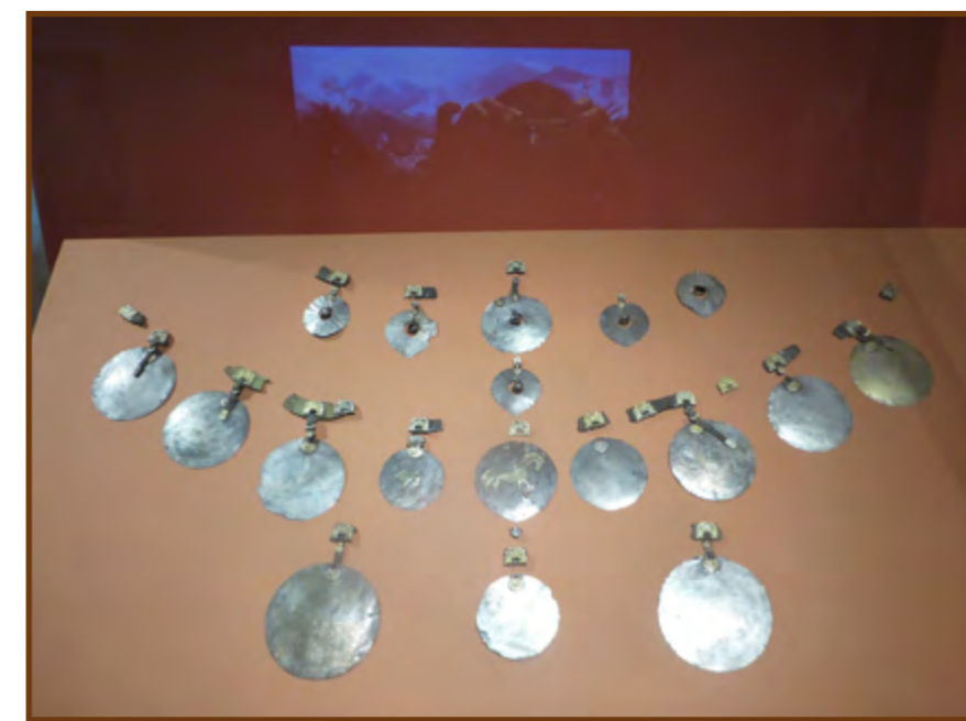
Részlet a kiállításból

Az első teremben a szarmata és a korai alán korszakból, az i.e. II. századtól az i.sz. V. századig terjedő időszakból származó műalkotások találhatók, főként ókori ékszerésznek remekművei. A második terem Alánia történetének következő szakaszáról, az i.sz. VI.-IX. századról szól, arról az időszakról, amikor az alánok elfoglalták az Európától elválasztó Kaukázus-hegység hegysorosait és a Selyemút egy szakaszát. A kiállításnak ez a része az alán katonai arisztokrácia által használt fegyvereket, lószerszámokat, arany és ezüst övvereteket mutatja be. A katonai hadjáratokban és a Selyemút kereskedelmében való részvétel révén az alánok jelentős gazdagságra tettek szert, amint azt a drága importcikk – értékes személyes díszítésként, üveg- és ezüstedények – mutatják.