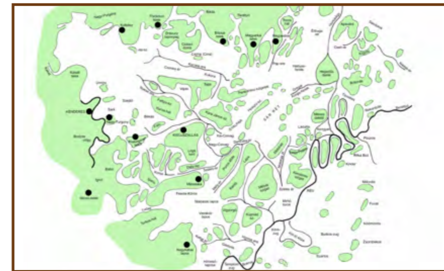
A Kara János mocsár szigetvilága

ezekekről Györffy István és Szűcs Sándor könyveiből tudhatunk meg érdekességeket. A szigeteket innen kis patakok, erek választották el egymástól, amelyek hol elmélyültek, hol szétterültek, s maguk a térképezők sem tudták követni futásukat. A lejtésnek megfelelően délre a Berettyó irányába futottak, de nem mind érte el, beleszakadt egy nagyobbba, vagy elveszett a mocsár szétterülő világában. A legészakibb a Kecse-ér, melynek nevét a Kecseri-víztározó tartotta meg, de erre futott a Csonka-ér, a Nyest-ere, a Kis-és Nagy-Csivag, a Falu-ere, a Széles-ér, a Mély-ér, délebbre a Kabai-ér és a Homok-ere. A Mírhó-rendszer keletebbre a Gyalpár környékén a Danczka-érről ér véget, amely a keletről a Hortobágytól vizet hordó