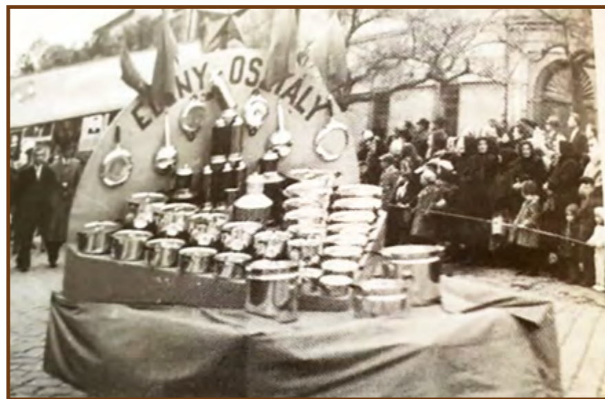
Fémnyomó és Lemezárugyár polgári termékei az 1955. május 1-jei felvonuláson

elkészült az első Szuper 100 -as hűtőszekrény prototípusa, melynek sorozatgyártását 1958-ban kezdték meg. Az első sorozatban 34 db készült el, majd az első félév végéig 130 darab került forgalomba. A nehéz idők ellenére a kereskedelem rögtön kétezeröt-száz darabot rendelt. A Mosonmagyaróvári Fémművelőüzem (MOFÉM) volt a feladata a villamos motorral egybeépített félhermetikusan kompresszor-gyártása. A hőfokszabályozót a Közlekedési Mérőműszergyár gyártotta. A minisztériumi terv szerint a Fémnyomó feladata pedig a hűtőszekrények egyéb alkatrészeinek (szekrényttest, elpárologtató, kondenzátor stb.) gyártásának a megteremtése volt.