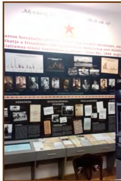
Részlet a kiállításból

A kitelepítettek másik csoportjához tartoztak azok a papok, szerzetesek, akiket különböző vidéki rendházakból telepítettek ki a kunszentmártoni kármeliták rendházába. Így Bajáról,