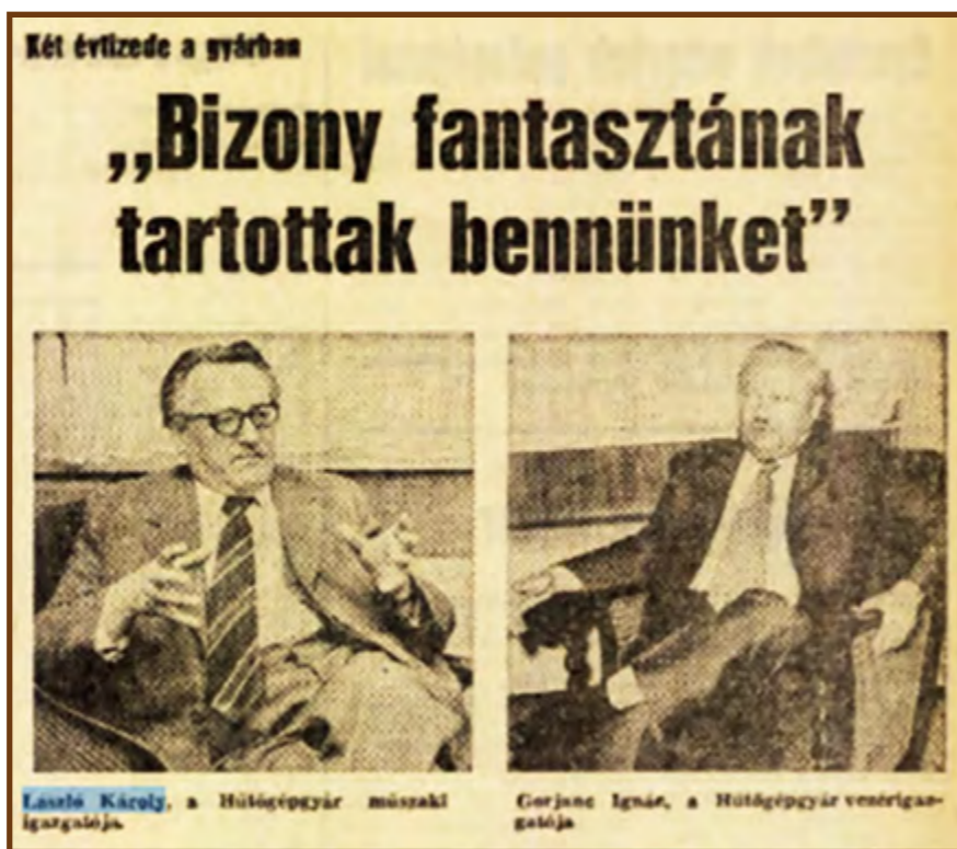
Közös interjú a megyei lapban

A Hűtőgépgyár egyik szép hagyománya volt, hogy aranygyűrűvel jutalmazta azokat, akik negyedszázada már