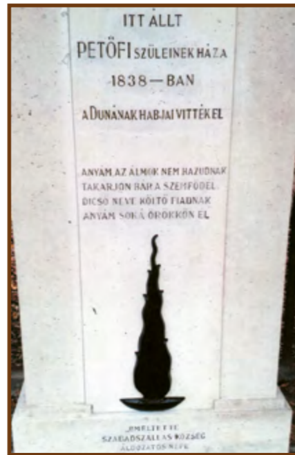
Emlékmű a Petrovics otthon kertjénél. 1818-tól 1841-ig laktak a szülők Szabadszálláson

Nem mondom meglepőt; valamennyien lázas izgalommal keresték Petőfi életének két legnagyobb rejtélyét: születési helyét és halálának