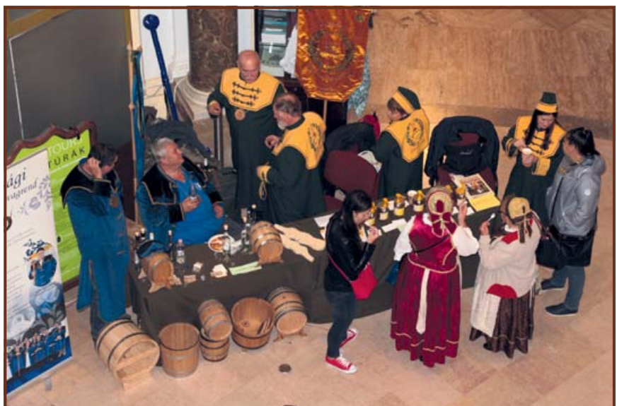
A Jászágó Pálinka Lovagrend és a Jászágó Mészlovagrend bemutató standja