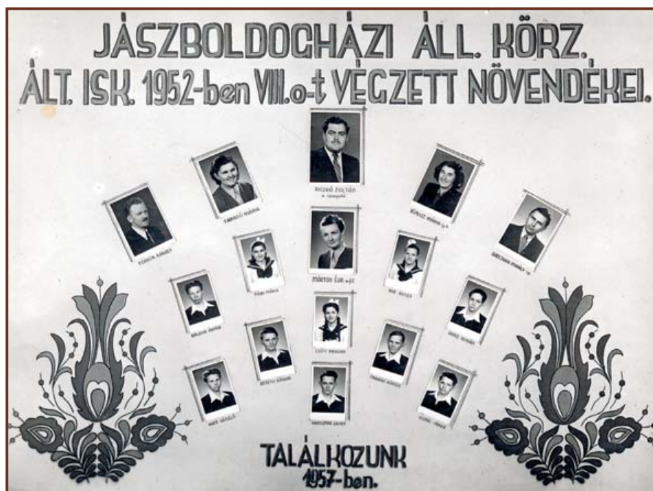
A jászboldogházi Általános Iskola 1952-ben végzett növendékei