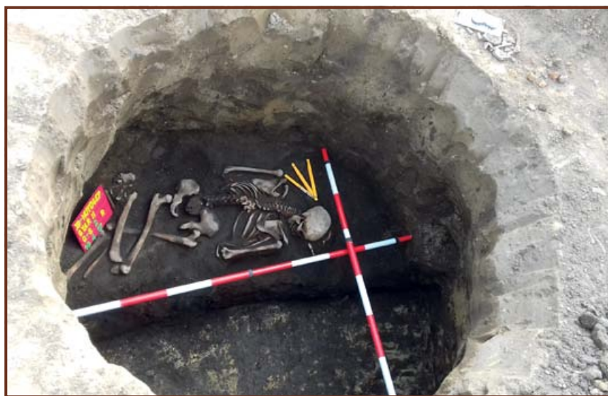
Bronzkori tárológödör emberi maradványokkal