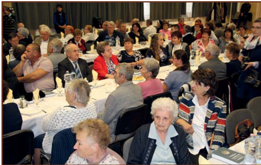
A születésnap ünnepség résztvevői