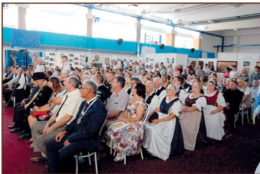
Helyi ünneplők és a testvér-településekről érkező vendégeink; jász viseletben a Jászsági Hagyományőrző Egylet tagjai