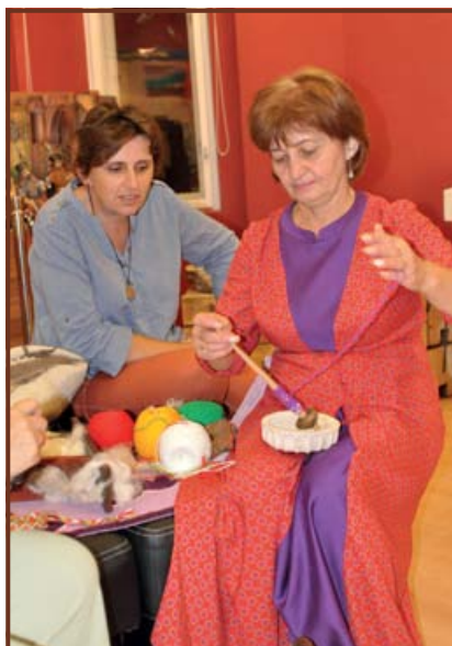
Fonás kis tömegű orsógombbal

Az egész országból érkező, érdeklő- dőkkel zsúfolásig megtelt Dombóvári Helytörténeti Gyűjteményben 2018. szeptember 6-án A Szent Sör előadá- son mindenki részletesen megismer- hette a sör főzősének közel tízezer éves történetét, ezen belül is az iráni népek árpamalátából főzött, komlóval ízesít- ett, az európai őstörténet szempontjából is meghatározó jelentőségű áldozati italát. Sőt, közben a vendégek folyama- tosan tisztították, áztatták, csíráztatták az árpát, majd örölték és pörkölték, főzték a malátát, komlózták a sörlét. Jól látszott, hogy Róza Boriszovna Tanelovát és Talata nevű csoportjának