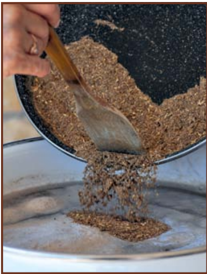
A megpörkölt maláta adagolása a sörléhez.