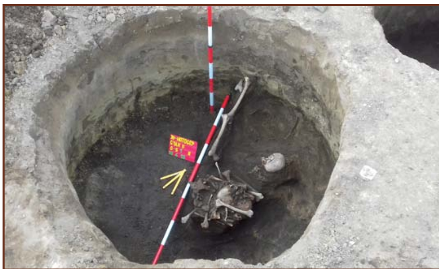
Bronzkori tárológödör emberi maradványokkal

A feltárások során bebizonyosodott, hogy a Hűtőgépgyár mellett, a Zagyva parton egy település húzódnak a késő bronzkorban, Kr. e. 1400 – 1200 környékén. A településen található több tárológödörben eltemetett emberi maradványok feküdtek. Ez a fajta elhantolás nem egyedi a bronzkorban, de az okaira teljes bizonyossággal még