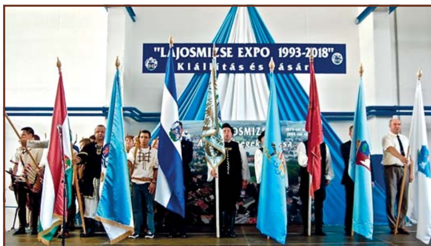
Tisztelgés zászlóval – A jubileumi ünnepség megnyitása