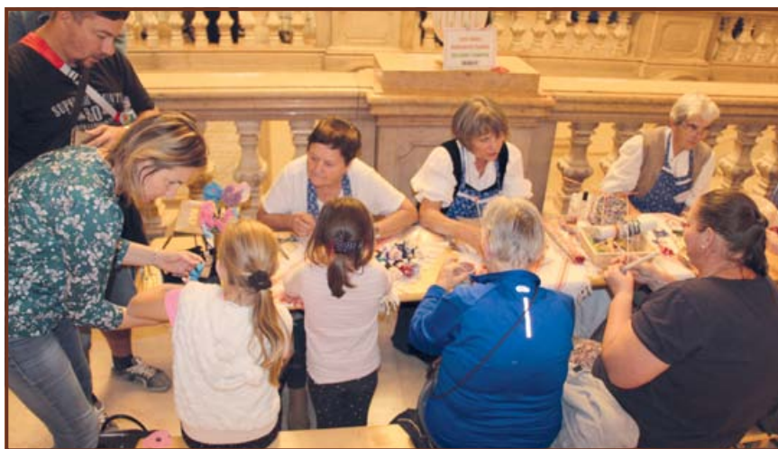
A jászkiérsi Csete Balázs Honismereti Szakkör játszóháza a Mezőgazdasági Múzeumban