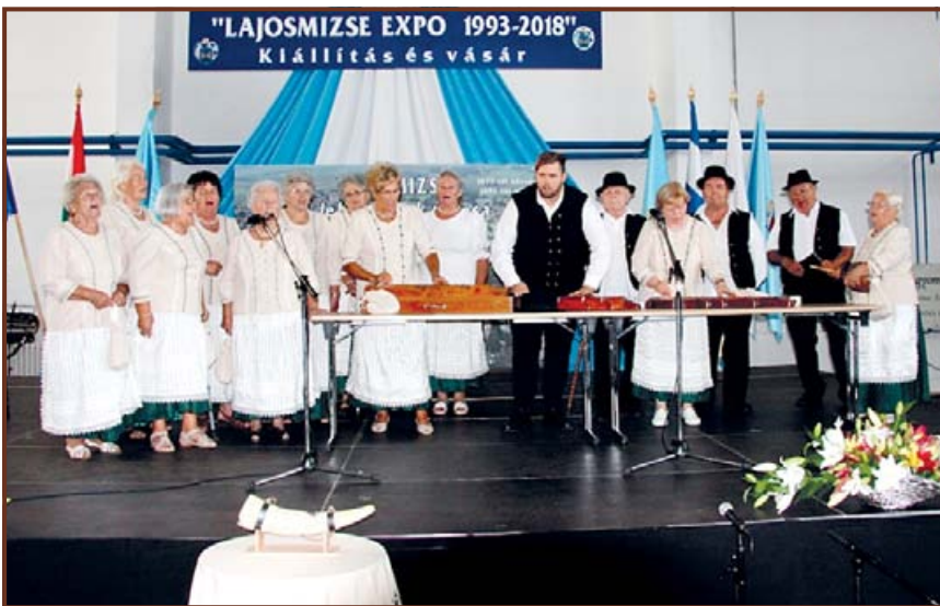
A Rózsa Sándor Citerazenekar és az Őszirózsa Népdalkör