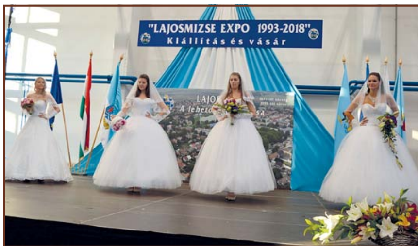
„2018. év stílusa és trendje az esküvőkön” – Família Szalon bemutatója.