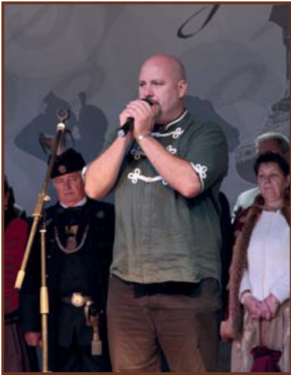
Bánfi Ferenc énekes