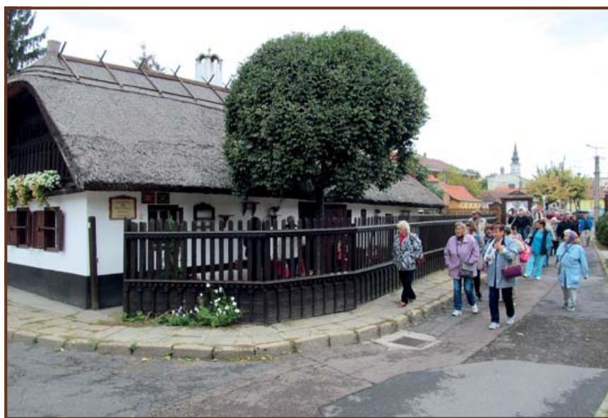
Alsószentgyörgyiek csoportja a Hadas városrészben

kintettük meg, ahol a különféle gépma-tuzsálemekről kaptunk szakszerű tá-jékoztatást, de a népi kovácsművesség remekei is különleges látnivalót jelentettek. Majd a közeli archaikus jellegű Hadas városrészben a népi lakóházakat kerestük fel, melyek alkotóházként, illetve tájházként működnek és együttesen őrzik a hadas településformát. A hadas családszervezet tulajdonképpen atyafiságot jelent: az egymással rokon családoknak volt „had” a nevük. Az egymás mellé települt családok hada lakó- és munkaközösség is volt egyben, akik jóban-rosszban összetartottak. Ezekben a nádfedeles háromosztatú (tisztaszoba, pitvar, füstös konyha) kis házakban várt ránk elsősorban a legnagyobb csoda: a díszes matyó népviselet ragyogó pompája. A jellegzetes matyó viselet és hímzés a mezőkövesdi íróasszonyok (hímzésrajzolók) keze nyomán virágzott ki a 19. század utolsó harmadától. A leghíresebb közülük Gáspár Mártonné Molnár Borbála (1876–1954), akit nagyapja ragadványneve után Kis Jankó Boriként ismertek. A róla elnevezett utcában, az ő emlékházában a gazdag színvilágú hímző