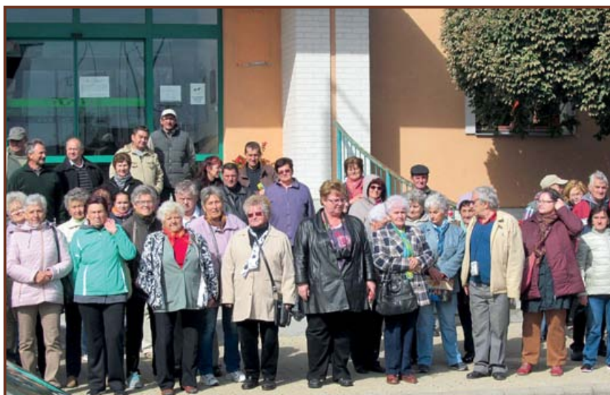
Csoportkép Mezőkövesd központjában

A nap végén Bogácsra már jó ismerősként érkeztünk. Bogács az alsószentgyörgyiek kedvenc üdülőhelye már évtizedek óta, ugyanis a nevezetes fürdőhely melletti üdülőben többen résztulajdonosok.