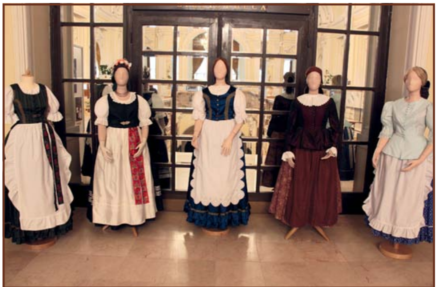
Jász viselet kiállítás a Mezőgazdasági Múzeumban