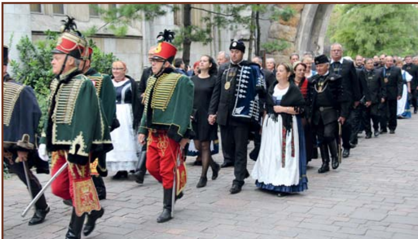
Huszárok, jászkapitányok és -kapitánynék a díszfelvonuláson