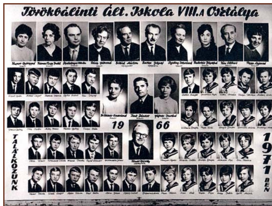
A törökbálinti Általános Iskola 8. osztályának tablóképe 1966-ból

Nemes, szép élethez nem kellene nagy cselekedetek, csupán tiszta szív és sok-sok szeretet.”