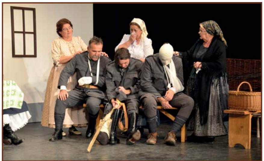
Hazaérkeztek a sebesült honvédek