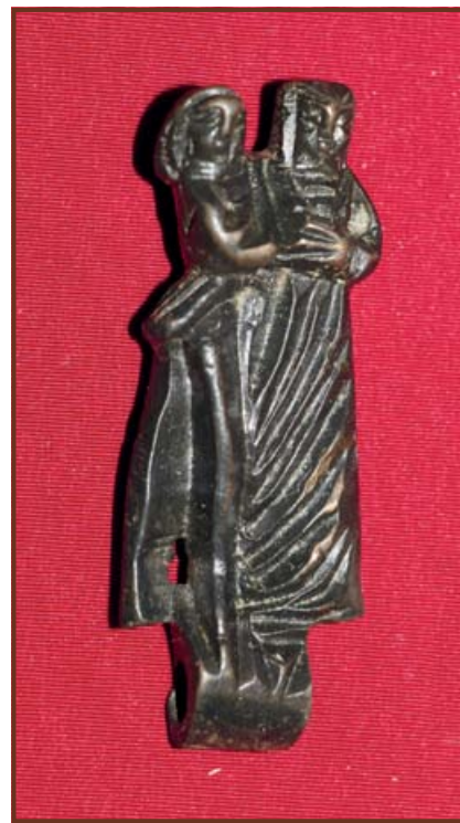
Szerelmespár kulcstartó a XV. századból a Jász Múzeum gyűjteményéből

hatvani szandzsák 1570. évi adóösszeírásában, azonban a „Kis fényszarusi-düllő” úgyszintén a Homok helynevekhez vezet. Tehát nagy valószínűséggel Homokszállás lehetett Jászfényszaru Árpád-kori magyar előzménye, s kezdetben itt telepedhettek meg a jászok is. Korai temetőjükből kerülhetett elő a Borjújáráson talált sír, s benne az a két