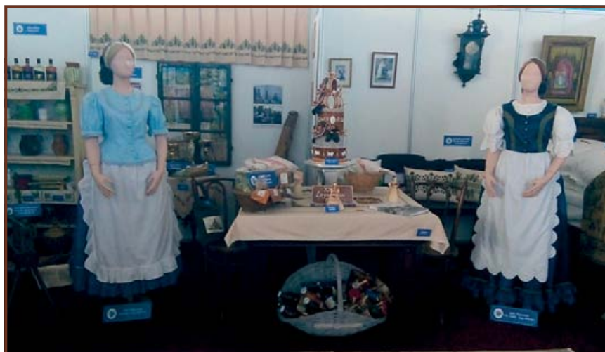
Hagyományörzés kategóriában különdíjas a Jász és kun gyökereink című kiállítás