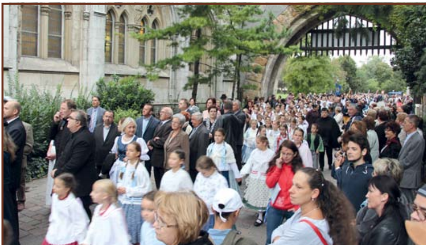
Hagyományörző csoportok a díszfelvonuláson