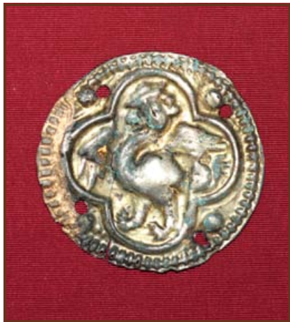
Hárpia ábrázolású korong a Jász Múzeum gyűjteményéből

A szűkebb haza múltjának megismerésére irányuló akarat, a hagyományok tisztelete és megőrzésének szándéka már évtizedek óta jellemző volt Fény-