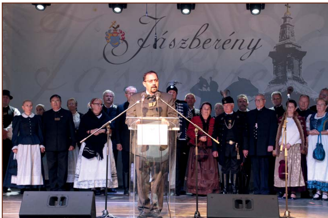
A jászok ünnepe a Vajdahunyadvárban

REDEMPTIO (latin szó, ejtsd: redempció) – visszavásárlás, megváltás, önmegváltás. A szó az 1745-ös jászkun redempcióra utal, amikor a jászok és a kunok példás összefogással, saját erejükből visszavásárolták régi kiváltságjogaikat. Mária Terézia magyar királynő 1745. május 6-án írta alá a jászok és a kunok redempcionális diplomáját.