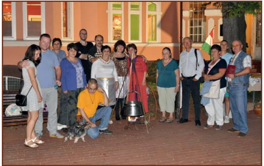
A dombóvári előadás és kóstoló legkitartóbb érdeklői