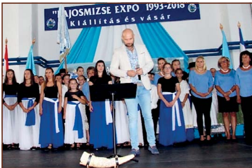
Kocsis Tibor énekes