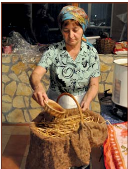
Sörlé szűrése kosárba tett szalmán keresztül.