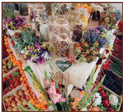
A közönségdíjas Mizsei Gazdák standja