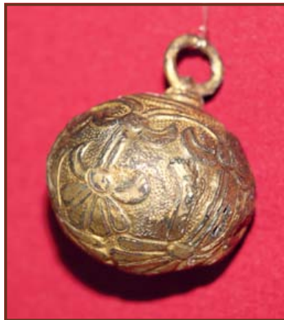
Honfoglalás-kori morva díszgomb a Magyar Nemzeti Múzeum gyűjteményéből.

is Zsigmond király megparancsolta Négyszállási Kompolt és Fényszarusi Lukács kapitányoknak, hogy az egri káptalan Szentandrás nevű birtokát adják vissza az egri püspökségnek. A régészeti kutatások azonban azt valószínűsítették, hogy a Jászság Kötöny kunjaival egy időben települt be. Következésképpen Jászfényszarunak a 13. század második felében már léteznie kellett. Kézenfekvőnek tűnhetne, hogy a jász Fényszaru azon a területen jött létre, ahol a település belterülete található. Azonban semmi nyoma nincs annak, hogy itt a tatárjárás előtt település létezett volna, s Jászfényszaru Zsigmond kori templomának temetőjéből sem kerültek elő a király uralkodásánál korábbi régészeti leletek. Következésképpen jelenlegi helyén a jászok akkor hozták létre településüket, amikor templomukat a 15. század első harmadában felépítették.