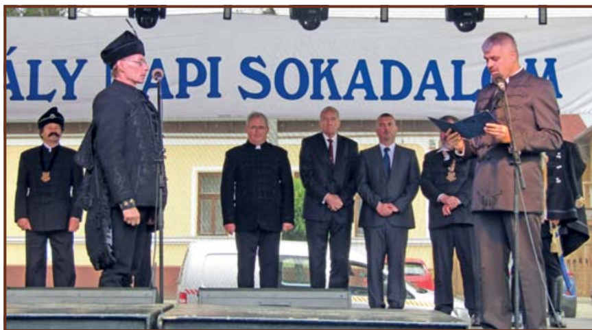
A nagykunkkapitány ünnepélyes beiktatásának egyik felemelő pillanata az eskütétel