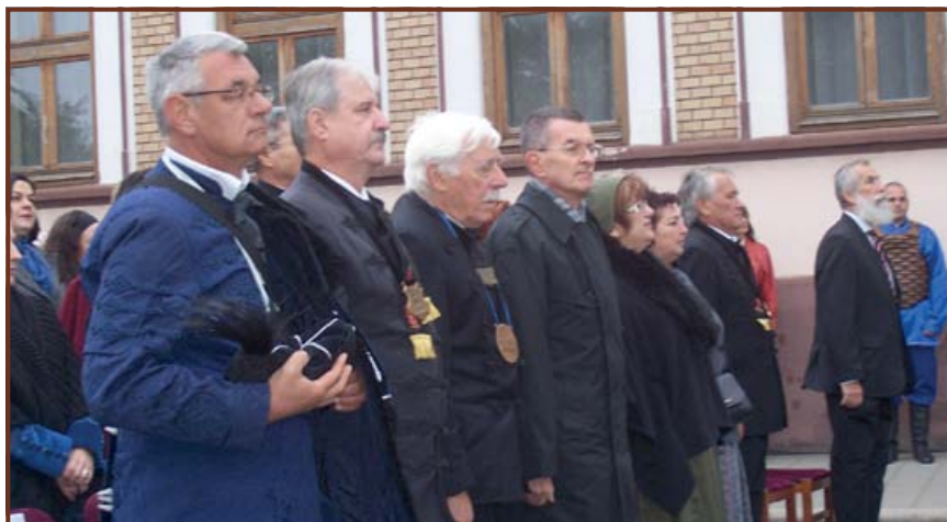
A kapitányavatás résztvevői