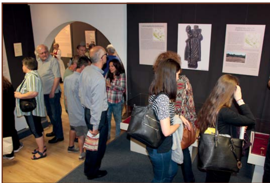
A kiállítás közönsége