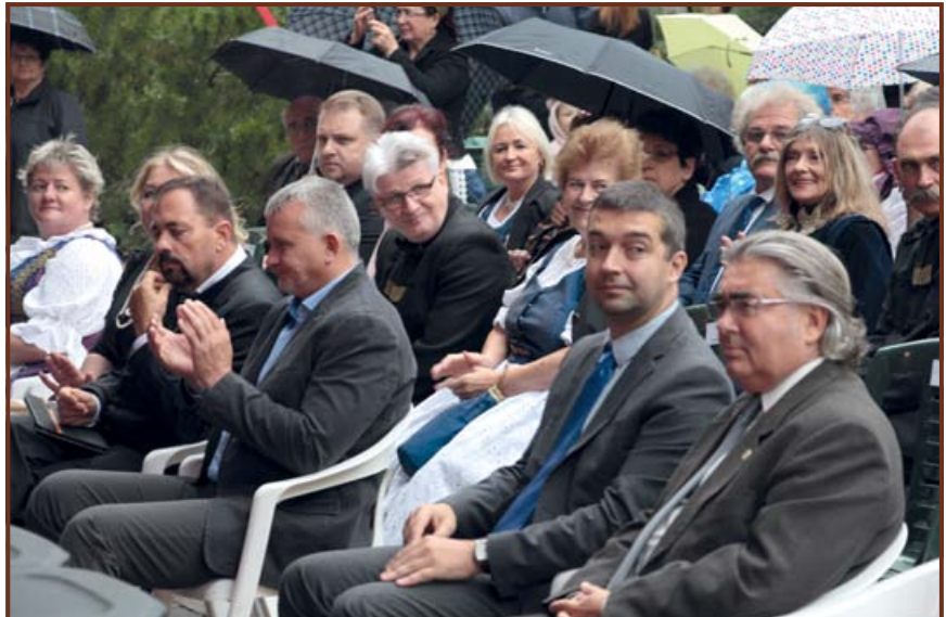
A jáász települések elöljárói a díszünnepségen