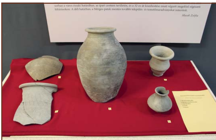
Szarmata kerámiák a Magyar Nemzeti Múzeum gyűjteményéből