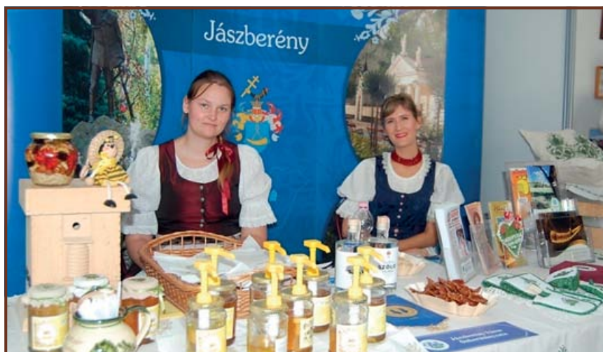
Testvárosunk, Jászberény kiállítási standján megkóstolhattuk a híres mézüket és a finom borukat, miközben gyönyörködhettünk a csodaszép jász hímzéseikben is