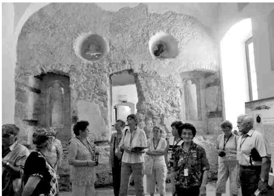
A Thury vár feltárt tere

üdvözölte a megjelenteket. Dukrét Géza bánsági elnök a határon túliak képviselőiben röviden ismertette az épített örökség védelmében kifejtett tevékenységüket. A színvonalas kultúrműsor után a polgármesteri fogadás zárta a napot.