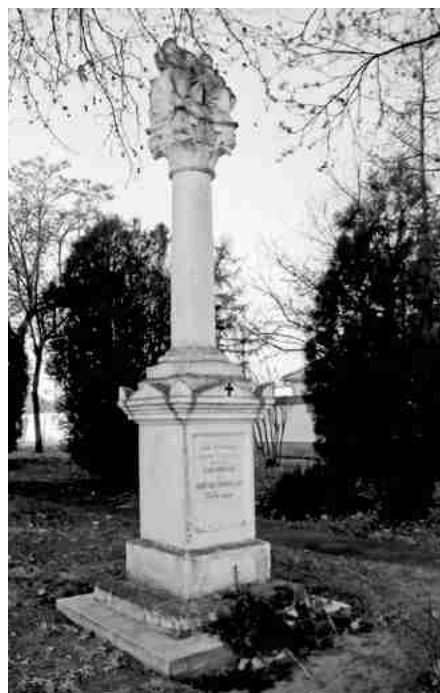
Szentháromság oszlop a Szentkúti templom kertjében