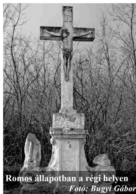
Romos állapotban a régi helyen

fel és a keresztre feszített Jézus korpuzát pedig egy árnyképszerűen kivágott „pléh Krisztussal” pótolták. A 2000-es évek elején a gatzól megtisztítva a környékét, jól láthatóvá vált és a bádog Krisztust is átfestették. Sajnos egy szélvihar csaknem a talpatánál döntötte el a jobb oldali szentet. Néhány héttel később a bal oldali mellékalak egy legális favágásnak esett áldozatul.” Ismertetőmet a következő sorokkal zártam: „Valószínű sokáig még ez a látvány fogadja az arra közlekedőket, ha csak valami csoda folytán nem kerül pénz a két mellékalak