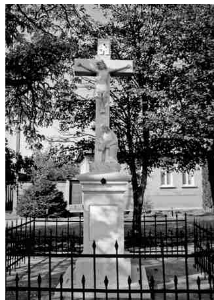
A felújított Sárközy-kereszt a Szent Imre herceg úton.