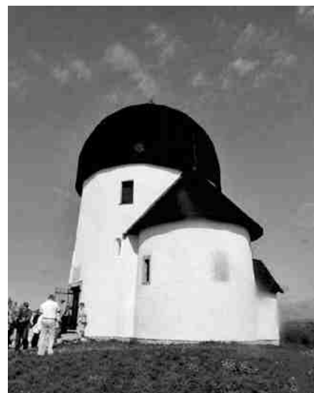
Az Ösküi templom