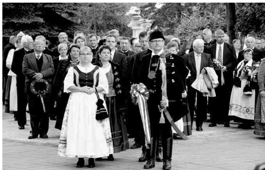
A jász, nagykun, kiskun delegációk koszorúzása a Jász emlékműnél