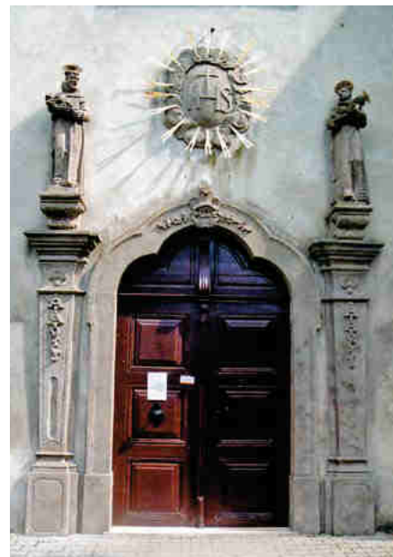
A Ferences templom főbejárata Szent Ferenc és Szent Antal szobrával (2009)