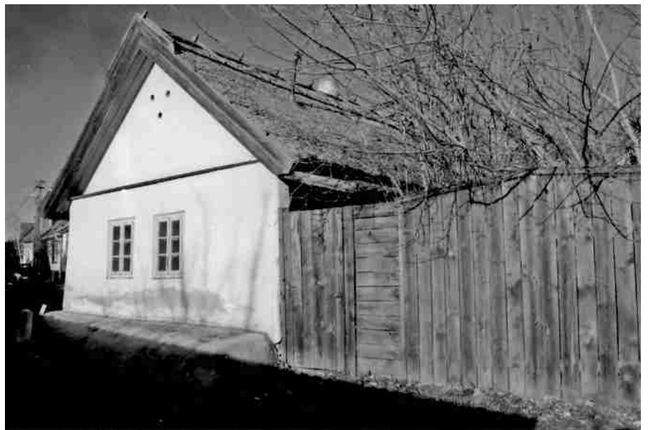
Fentről lefelé: Szelei út 26., Szelei út 35., Kigyó utca 12.