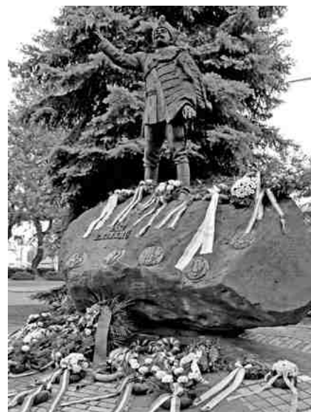
A virágokkal borított Jász-emlékmű