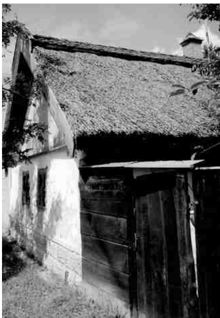
Kender utca 12.