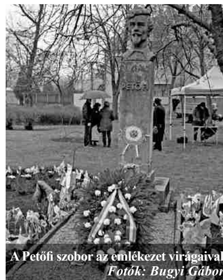
A Petőfi szobor az emlékezet virágaival