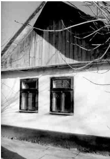
Szelei út 66.