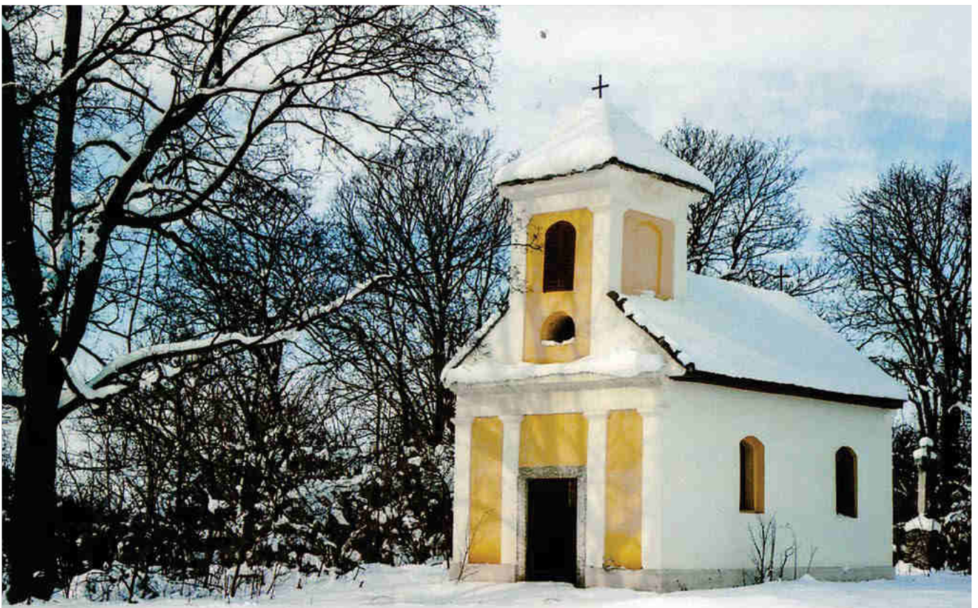
A kerekudvari Gosztony-kápolna