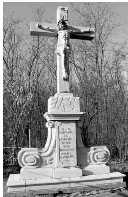
A kereszt és talpzata már megújult