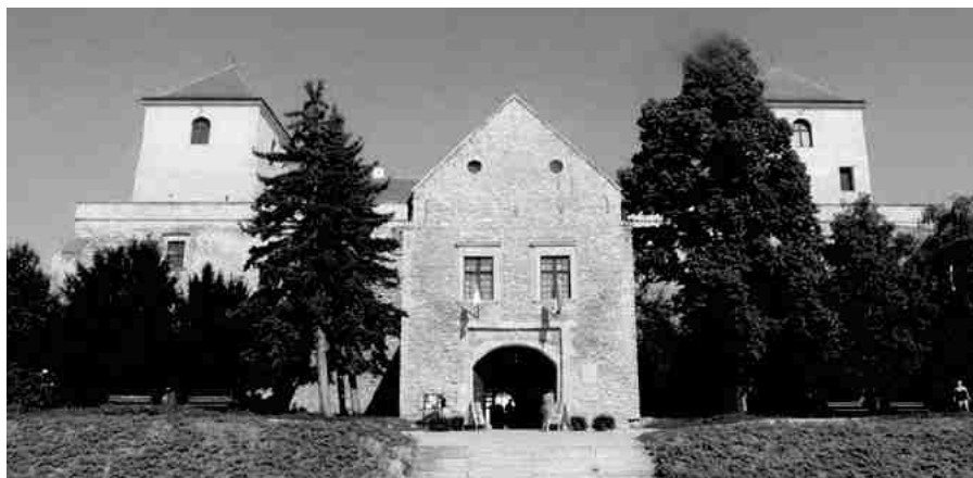
A Thury vár