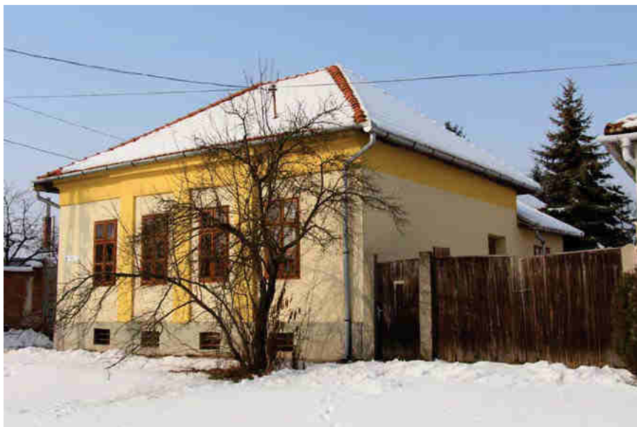
A lakóház mai látványa

Jászberény Hentes utca 15. szám alatt egy szépen felújított régi polgári ház látható, mely városképi jelentőségű és helyi védetség alatt áll. Ez a lakóház XIX. század elején épülhetett s egykor a Szele család tulajdonában állt, Szele Ambró ház néven volt egykor ismert. Ebben a házban született Szele Gábor segédpüspök az egri egyházmegye köztisztviselőként álló jeles egyházi személyisége.