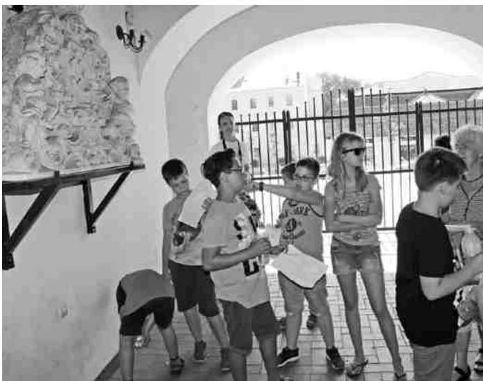
Városi sétánk során a Jászkürt fogadót is felkerestük