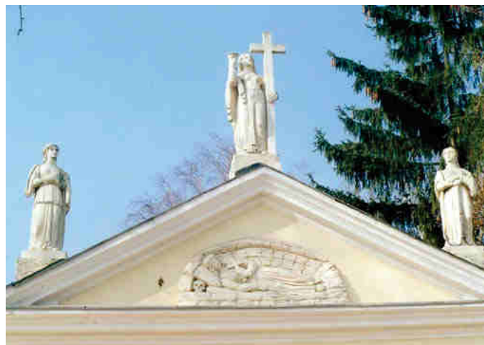
Faragó László összeállítása