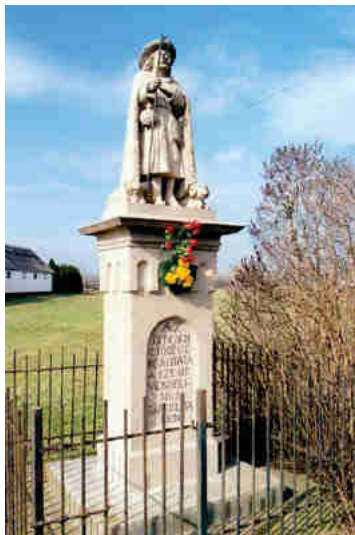
Szent Vendel szobor (2010)