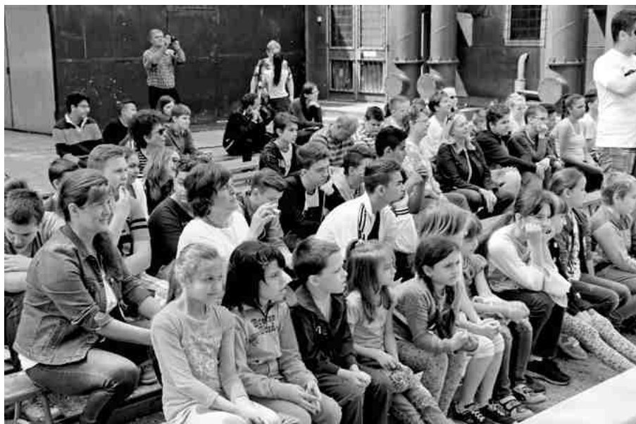
A Vásárhelyi ünnepség közönsége