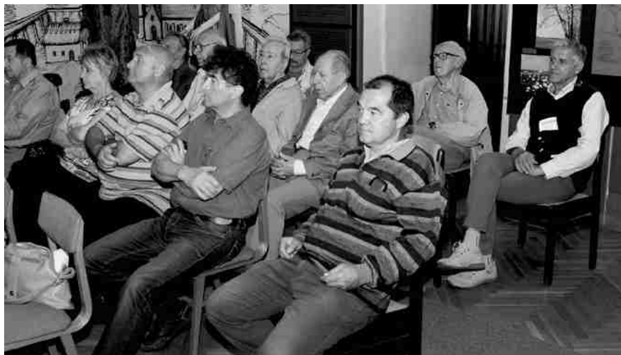
A közgyűlés résztvevői