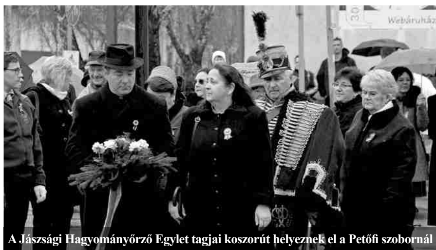
A Jászsági Hagyományörző Egylet tagjai koszorút helyeznek el a Petőfi szobornál