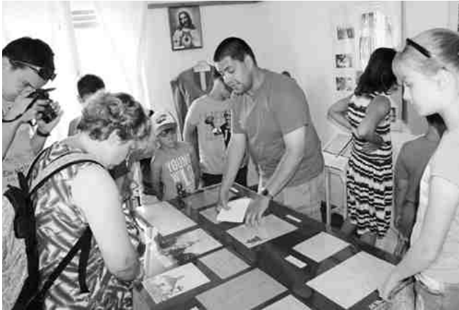
A jászboldogházi Egyháztörténeti gyűjteményben