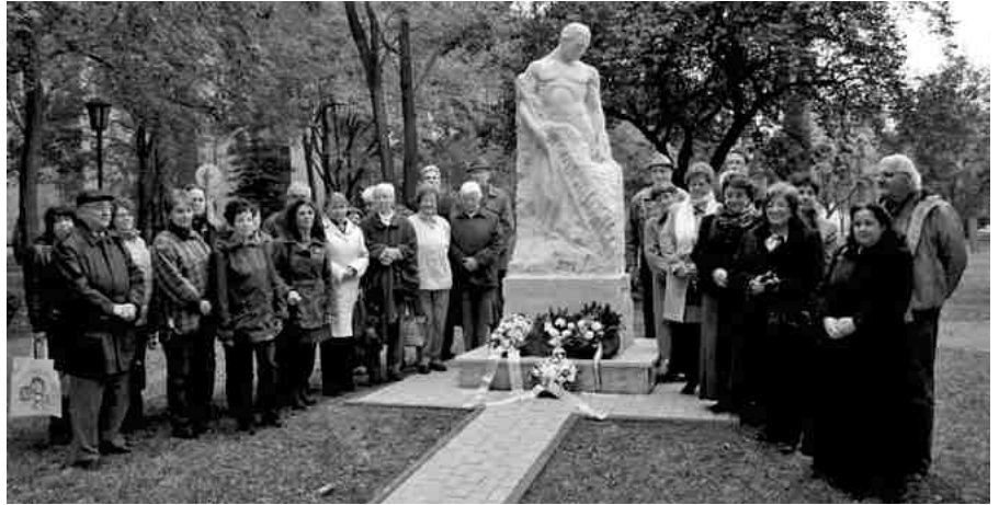
Csoportkép a felújított Török-magyar emlékmű előtt

Fekete Lajos Kossuth-díjas történész, turkológus, levéltáros, paleográfus, egyetemi tanár, a Magyar Tudományos Akadémia tagja 1981. június 12-én született a Komárom-Esztergom megyei Tardoson. Felsőfokú tanulmányait 1909-től a Budapesti Tudományegyetemen végezte, bölcsészdoktori oklevelét 1914-ben szerezte meg. Az I. világháború kitörésekor bevonult, s az orosz fronton harcolt. 1915-ben Przemyslnél fogságba esett, s az öt évig tartó szi-bériai fogsága alatt tanult meg törökül. 1920-ban tért vissza Magyarországra. 1921-től Budapest Székesfőváros Levéltárában dolgozott, majd 1923-tól