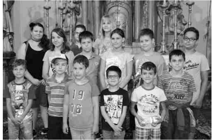
A jászdózsai Szent Mihály templom oltáránál