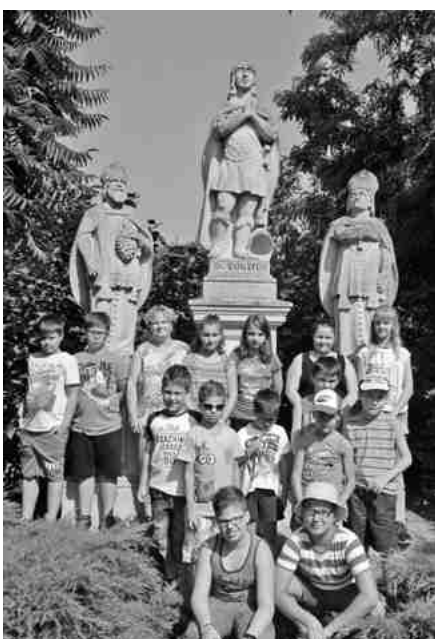
A Városvédő Ifjúsági tábor résztvevői az időjós szentek szobránál