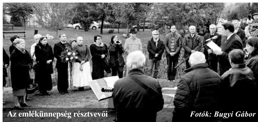
Az emlékünnepe résztvevői