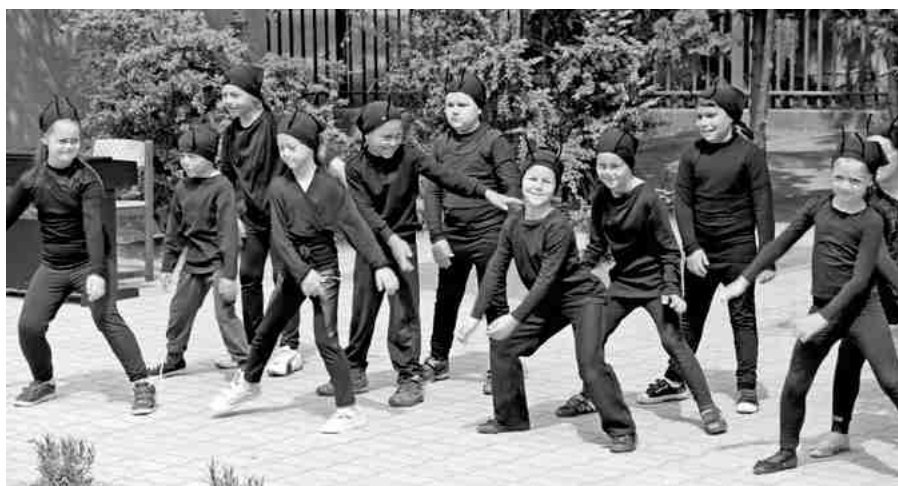
Részlet az ünnepi műorból