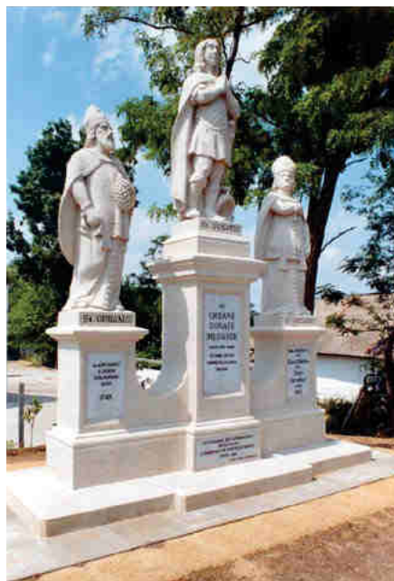
Időjósító szentek szobrai (2009)