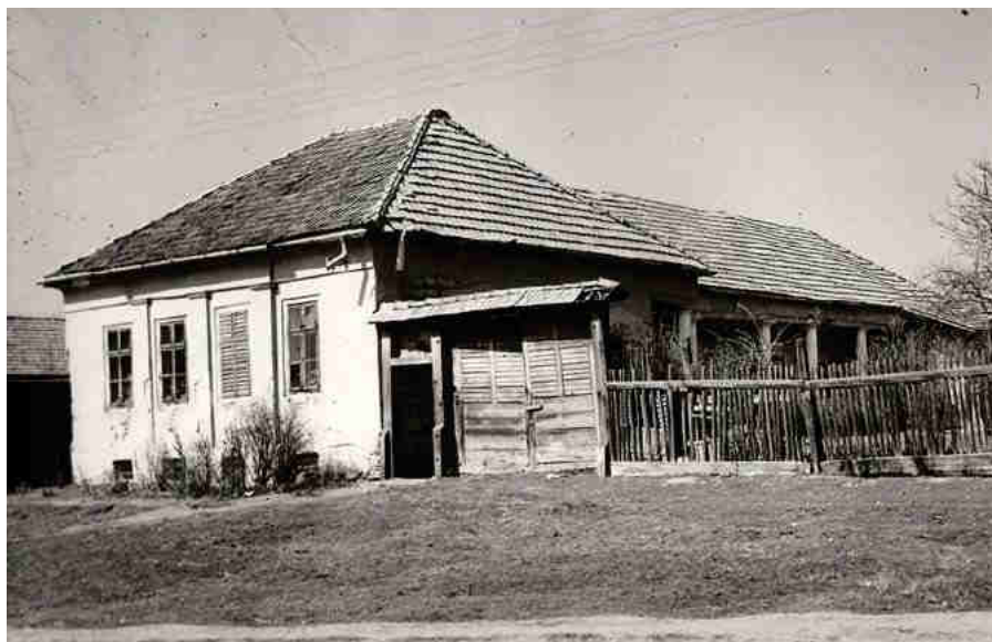
A szülőház az 1920-as években

Egerben az érsekség központjában, különböző beosztásokban végezte áldásos tevékenységét.1885.szeptember 13-tól érsekhelyettes; 1888. június 1-jén püspökké nevezték ki,1885. Szeptember 9-én szentelték fel s mint egri segédpüspök fejezte be földi pályáját. Szele Gábor egész életében hű maradt városához, hű maradt népes családjához. Családi rendezvények alkalmával gyakran hazlátogatott. A jászberényi Katolikus