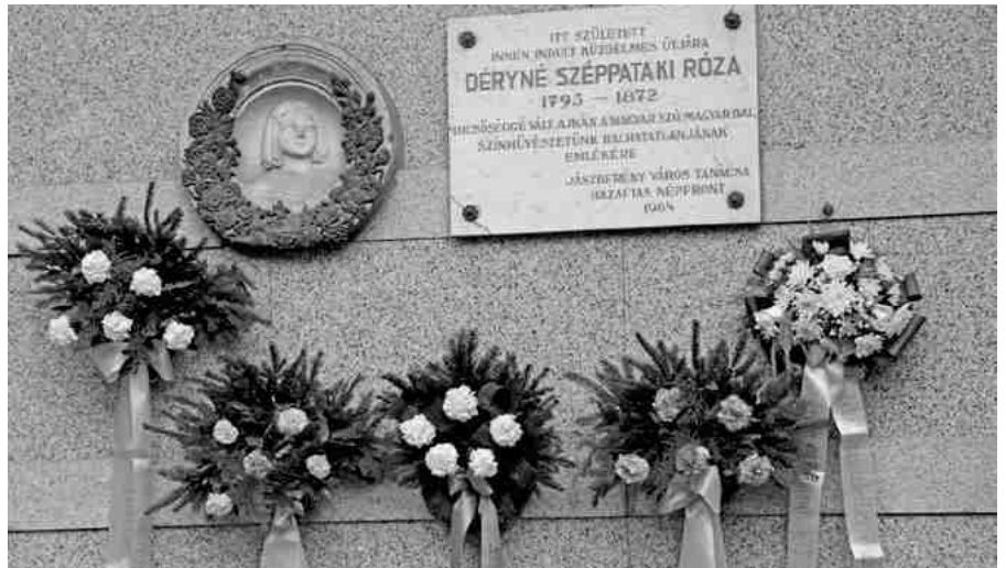
Koszorúk Déryné emléktáblájánál