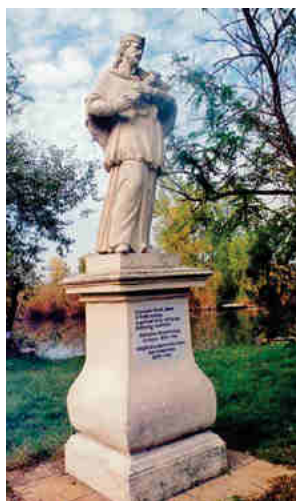
Nepomuki Szt János szobra a horgásztónál (2009)