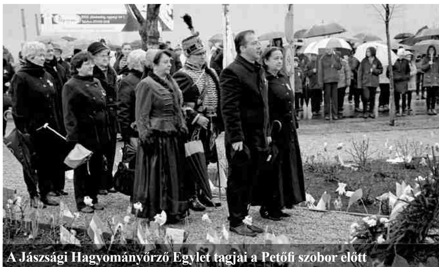
A Jászsági Hagyományörző Egylet tagjai a Petőfi szobor előtt