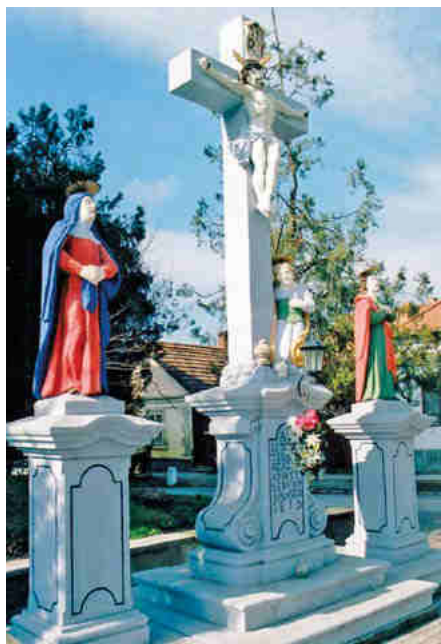
Juhász Kereszt (Kálvária) (2015)