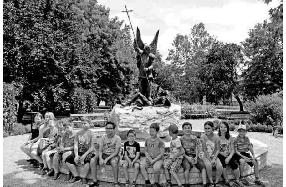
A jászdózsai Szent Mihály tér szökőkútjánál