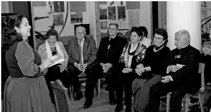
Az emlékünnepek résztvevői

ban a felesége mellett, a jászberényi Új temetőben talált. Sírját 2006-ban a Nemzeti Sírkert részévé nyilvánították.